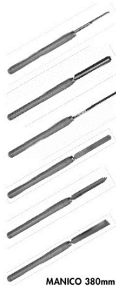
MANICO 380mm handle 380mm